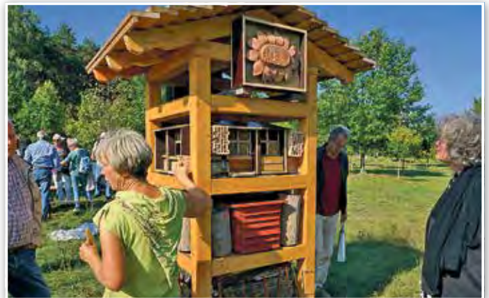
Blick auf das Insektenhotel