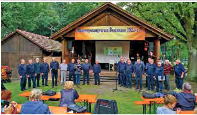
Der MGV in Aktion