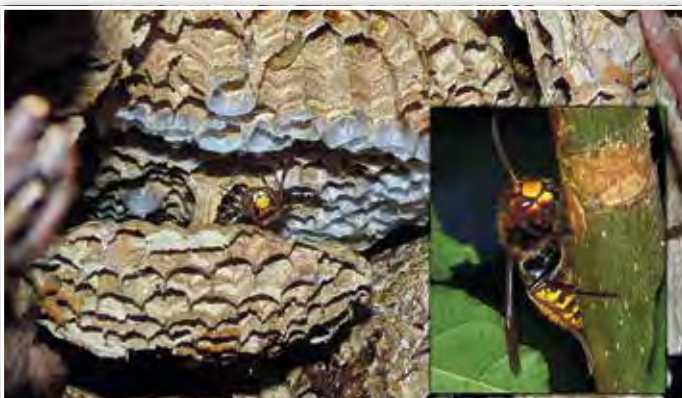
Hornissen am Pätzer Uferweg