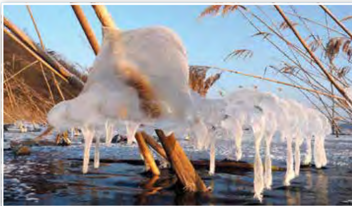
Eisiges „Urtier“ am Pätzer Vordersee