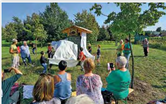
Enthüllung des Insektenhotels