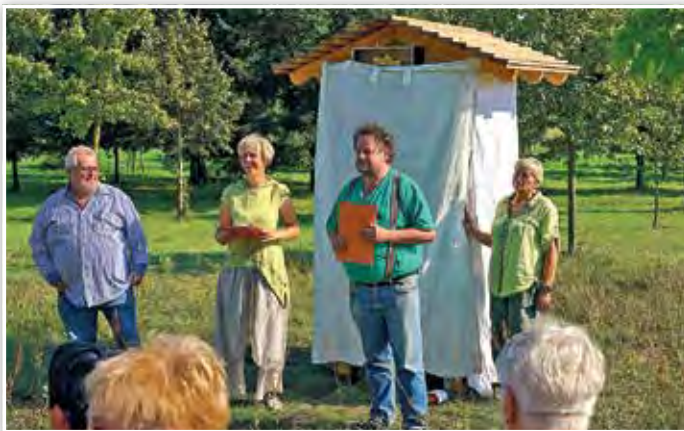
Begrüßung der Gäste