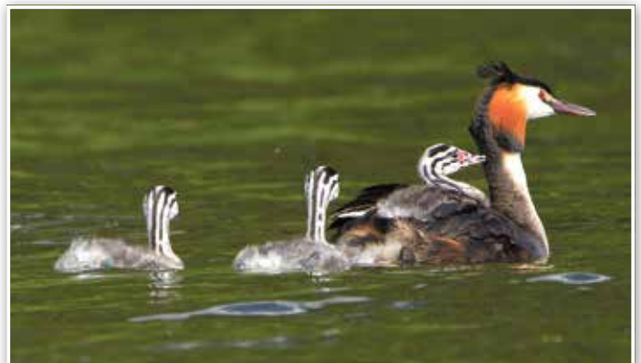
Haubentaucher mit Nachwuchs