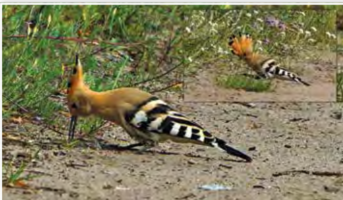
Wiedehopf am Gräbendorfer Weg

Auf unseren Seen können wir oft Haubentaucher beobachten. Anfang Juni begrüßten mich neben den Eltern drei kleine Haubentaucher, die im Wasser munter umher schwammen. Sie sahen durch ihr Streifenmuster lustig aus, fast wie abgewandel-