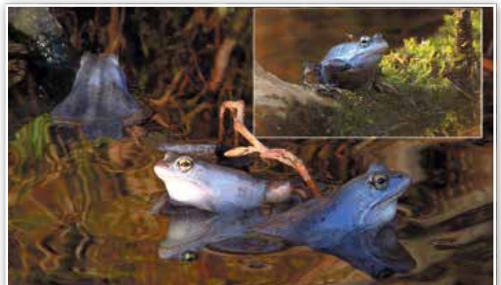
Moorfrösche am Pätzer Vordersee