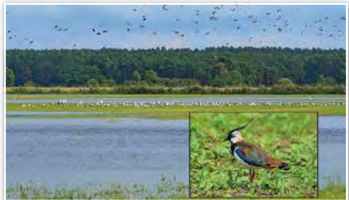
Hochwasser mit Möwen und Kiebitzen auf dem Pätzer Plan