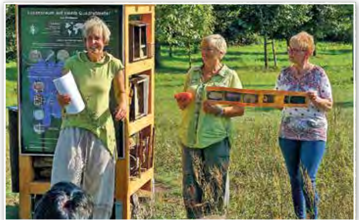
Berichtet wurde aus dem Leben der Wildbienen