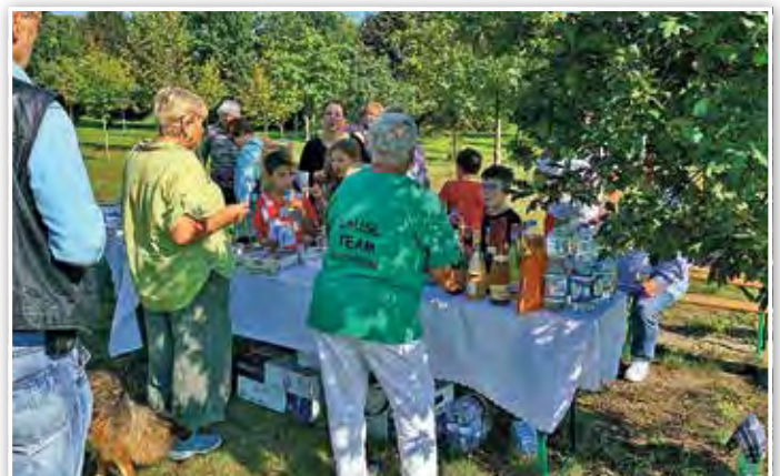
Getränke- und Knabbereistand