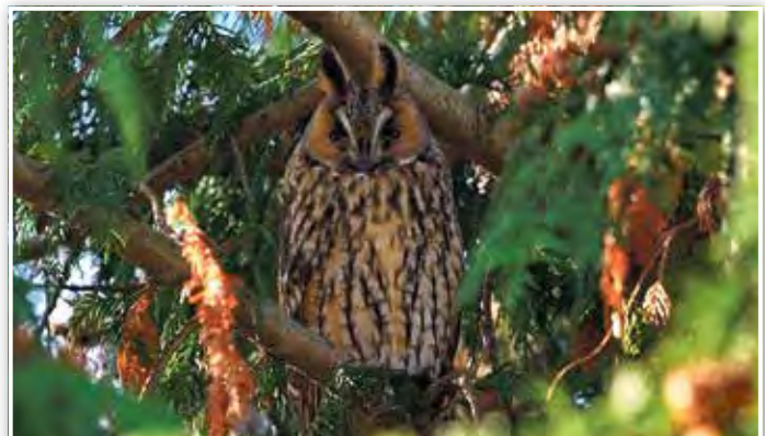
Waldohreule in Pätz