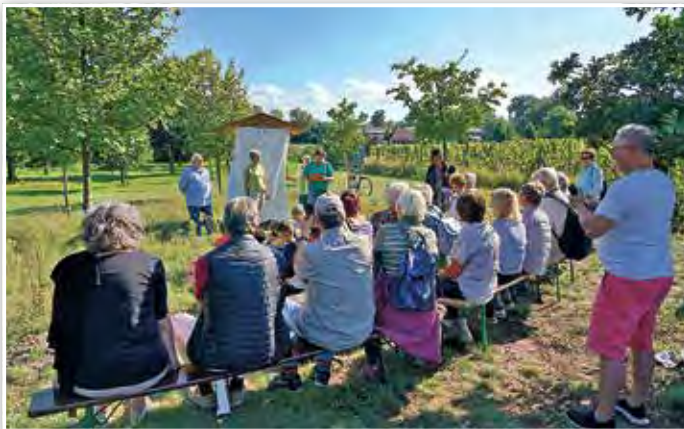
Gespanntes Warten auf die Einweihung