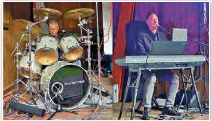
Das Duo „Sing-4-fun“