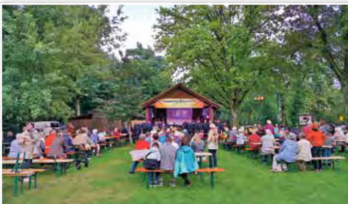
Das Publikum vor der Bühne