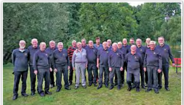
Der Männergesangverein mit dem Havixbecker Gast