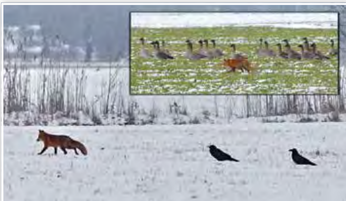
Fuchs mit Raben und Gänsen auf dem Pätzer Plan